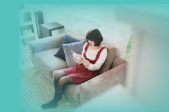
読書やリラックスタイムに

これは、溶存水素量 1 p p m の水素水 1 5 0 リットル分の水素を 1 分間で発生させています。