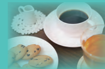
ティータイムと一緒に